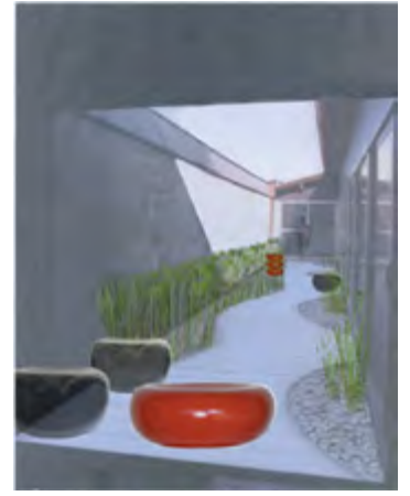
Notes de couleur avec un mobilier/objet logé dans les courbes du cheminement en châtaignier, dans la fraîcheur des plantes