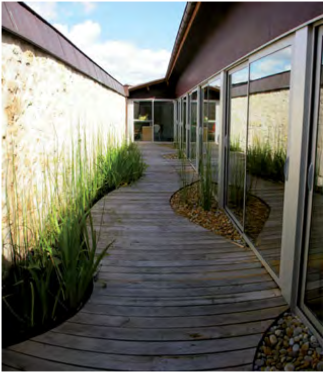
Massifs ondulants de prêles et d'iris le long du mur en pierre