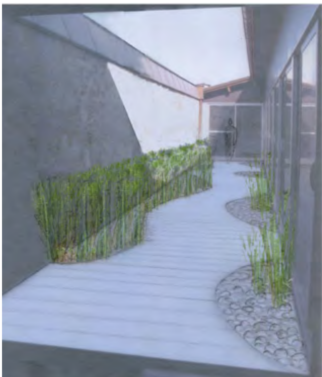
Jeux de reflets des plages de galets dans les baies vitrées effet de symétrie doublant la taille du jardin