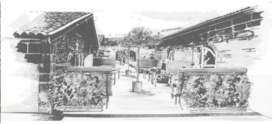
Arbustes persistants taillés mur en pierre