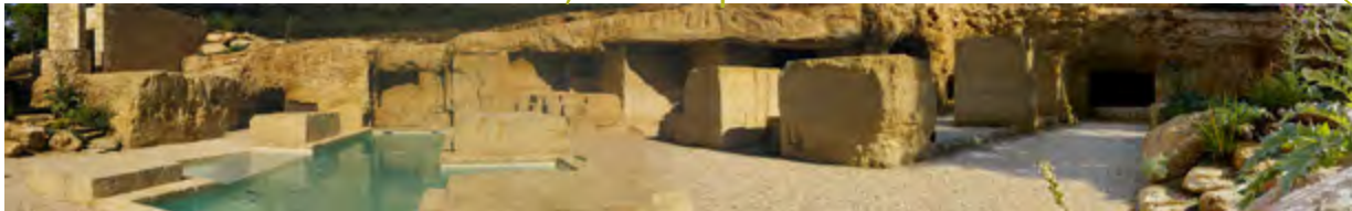
Jardin sec organisé en strates minérales et végétales