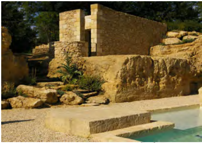
Poolhouse: volume épuré en moellons, comme taillé dans la roche des carrières