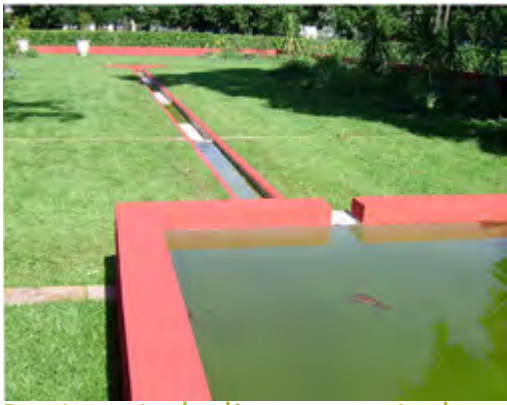
Bassin et rigole d'eau traversée de lignes de briques