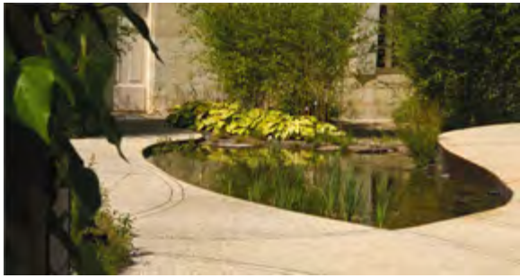
Nappes de béton et bassin de plantes aquatiques