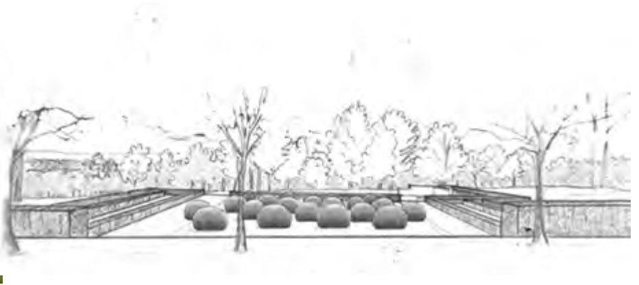
Jardin d'art topiaire: boules de buis, parterres d'ifs, écume de Perovskia